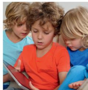
Tijdens het spelen raken de hoofden elkaar en kan hoofdluis zich verspreiden.

Hoofdluis veroorzaakt meestal jeuk, maar niet altijd. Het is aan te raden uw kind regelmatig op hoofdluis te controleren. Als u het haar met een fijntandige kam doorkamt boven een vel wit papier, kunt u zien of er luizen uit het haar vallen. Hoofdluizen zijn grijsblauw of, nadat ze bloed opgezogen hebben, roodbruin. De beestjes zijn zo groot als een sesamzaadje. Hun eitjes (neten) zijn witte, grijze of zwarte stipjes die op roos lijken. Roos zit echter los en neten kleven juist aan het haar vast.